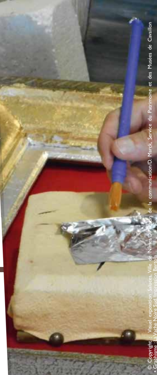
Graphisme : La Vache Noire Sud, Impression Bertola

Renseignements et inscriptions auprès de la Conservation du Patrimoine et des Musées au 04 90 72 26 86 ou musees.mediation@ville-cavaillon.fr